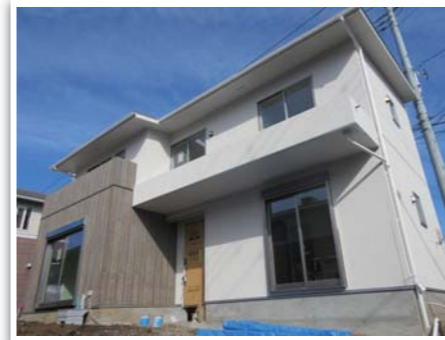
つくばみらい市絹の台 物件外観写真

茨城県守谷市とつくばみらい市に分譲住宅『売電ソーラーハウス』が完成しました！売電ソーラーハウスは、名前の通り10kWもの太陽光パネルを搭載しており、毎月売電収入が得られる為、住宅ローンの返済に充てることもできます。また、広いリビングやお子様安心して遊ぶことが出来るお庭、3台駐車可能などところも魅力です。週末はイベントも開催しておりますので、ぜひ遊びに来てくださいね！