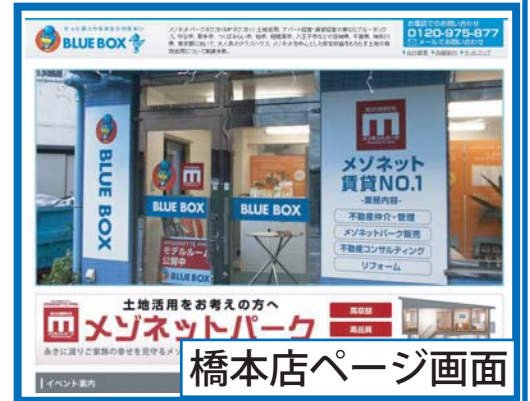
橋本店ページ画面

昨年の12月より橋本店が新装オープンし、橋本店のHP専用ページも同時に開設しました！橋本店ページでは橋本店で働いている社員の紹介はもちろん、橋本店での建替成功事例や橋本店主催のイベント案内や新商品の紹介など、お得な情報が盛りだくさん！詳しい情報は新しい橋本店にお越しいただくか関東版HPから橋本店紹介ページをご覧ください！