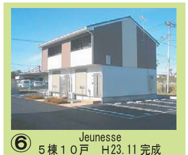
⑥ Jeunesse 5棟 10戸 H23.11 完成