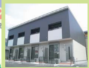
⑦ SEAS 1棟 4戸 H24. 3 完成