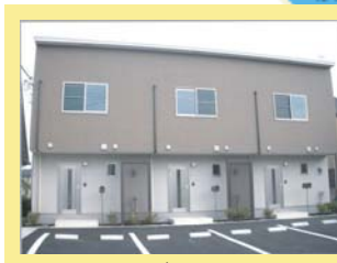
③ ドレミ 1棟 3戸 H24. 4 完成