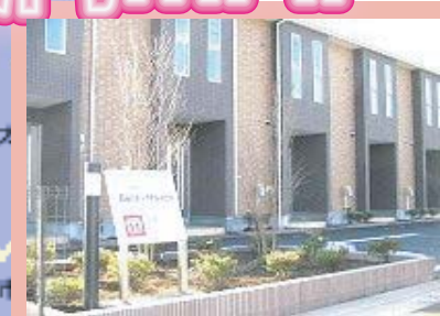
⑧ Belle-Maison 1棟 7戸 H24.12 完成