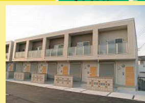
⑤ Maison de Gray A-B 2棟 9戸 H24. 8 完成