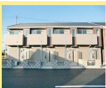
④ Sun Excel A-B 2棟 8戸 H24.12 完成