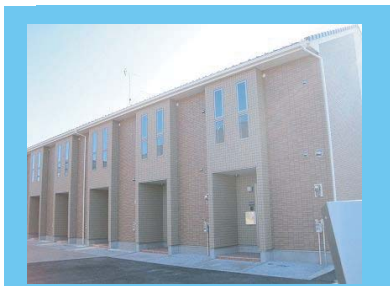
① vesta 2棟 9戸 H23.12 完成